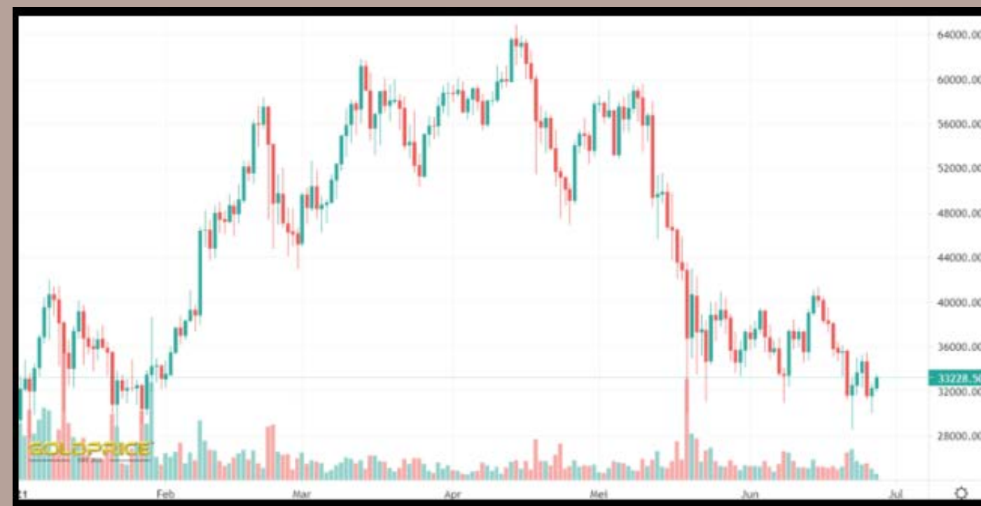
Grafik harga Bitcoin dari awal tahun 2021 sampai 27 Juni 2021.