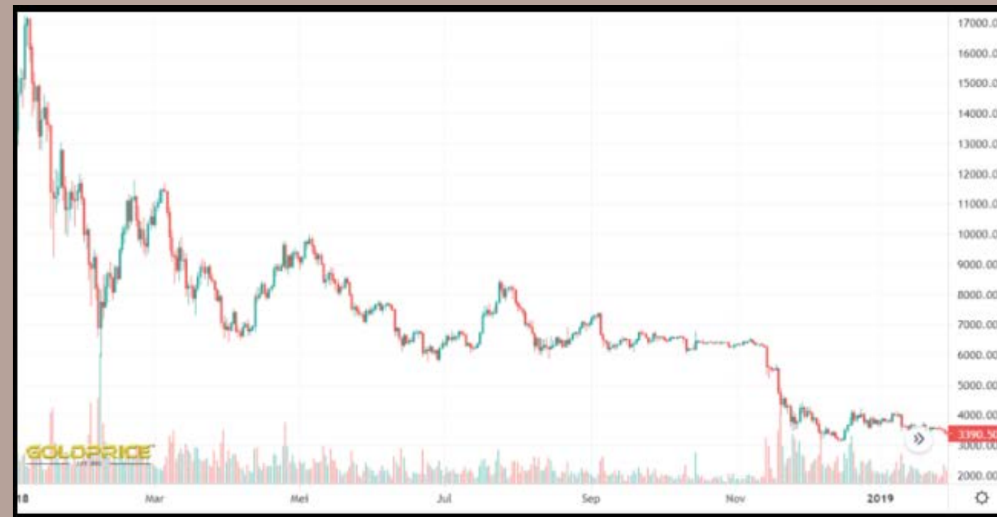
Grafik harga Bitcoin sepanjang 2018

Penelitian dengan metode kualitatif didapat melakukan wawancara secara intens dan mendetail dengan panduan berupa pertanyaan-pertanyaan sebagai instrumen dan studi kepustakaan yang dapat memperkuat hasil yang akan diperoleh dari penelitian.