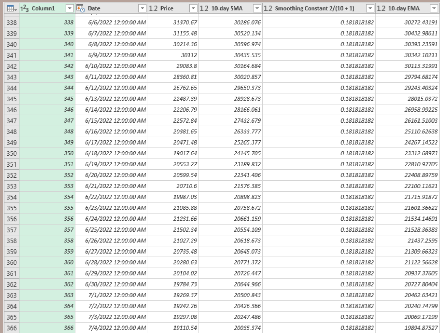
Table 1. Pergerakan harga Bitcoin dan peramalan dengan metode Moving Average

Dari hasil pemrosesan data harga bitcoin dari 4 Juni 2022 – 4 Juuni 2022 didapatkan trend yang lebih banyak negative dilihat dari simple moving average maupun Exponential Moving Average.