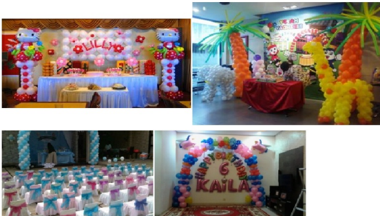
Gambar 3 Tampilan Menu Untuk Ulang Tahun