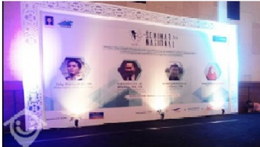
Gambar 4 Tampilan Menu Untuk Dekorasi Gedung