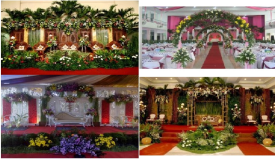
Gambar 2 Tampilan Menu Untuk Pernikahan